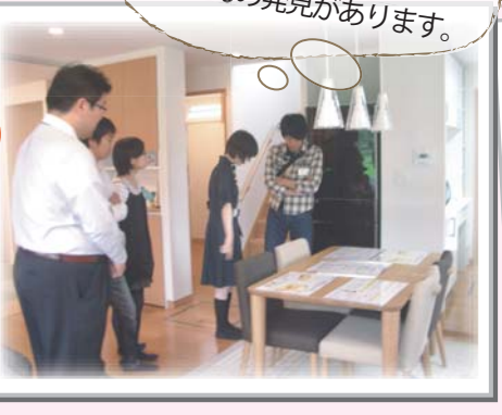
お家の中を見学! たくさんの発見があります。