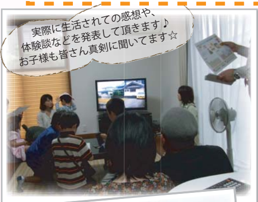
実際に生活されたの感想や、 体験談などを発表して頂きます♪ お子様も皆さん真剣に聞いてます☆

※クオカードはお一家族様につき一つに限らせて頂きます。 ※クオカードは、各イベント参加につき、1度限りとさせていただきます。 ※クオカードは、後日、一週間以内にお送り致します。