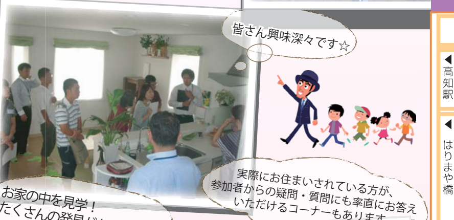
皆さん興味深々です☆