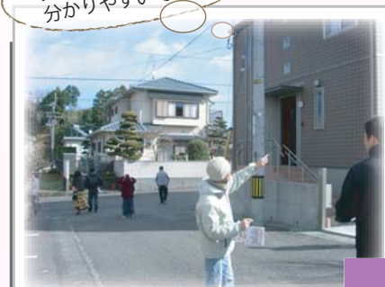
窓の大きさや、高さ・ 実際のタイルの色など 分かりやすいですね!

昼食 はご用意しております。 小さいお子様 がいらっしゃる方も ご安心下さい。見学中は女性スタッフが お預かり致します。