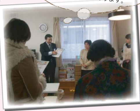
実際にお住まいされている方が、 参加者からの疑問・質問にも率直にお答え いただけるコーナーもあります。