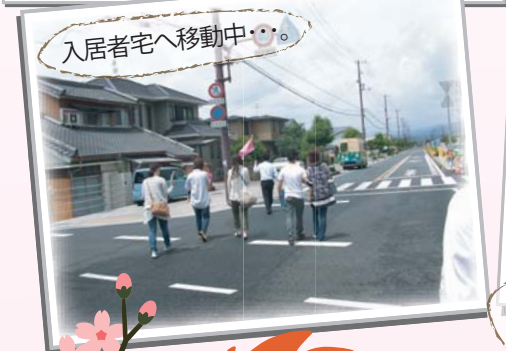
入居者宅へ移動中...

北 駐車場 ※① 南国市、美術館(東)方面よりお越しの際は、 展示場・北側 より入れます。 ※② はりまや橋(西)方面よりお越しの際は、 展示場・南側 より入れます。 南 駐車場 ※① 南国市、美術館(東)方面よりお越しの際は、 事務所・北側 より入れます。 ※② はりまや橋(西)方面よりお越しの際は、 事務所・南側 より入れます。