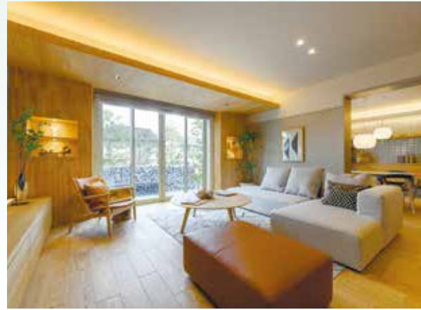
【広々としたリビング】