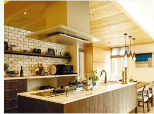
【こだわりのキッチン】